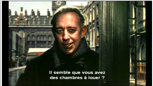
La gare Saint Pancras

Ladykillers , Alexander Mackendrick (1955)