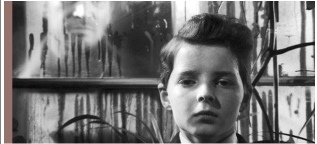
The Innocents , Jack Clayton, 1961