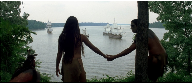
The New World , Terrence Malick, 2005