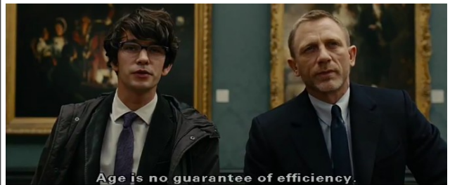
La National Gallery et le tableau de Turner