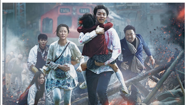
Last Train to Busan , Yeon Sang-ho, 2016