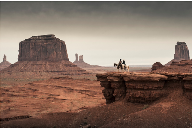
The Searchers , John Ford, 1956