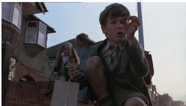
Londres pendant le Blitz

Ladykillers , Alexander Mackendrick (1955)