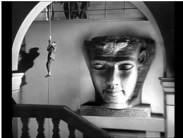
Le British Museum