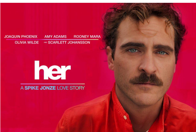
Her , Spike Jonze, 2013