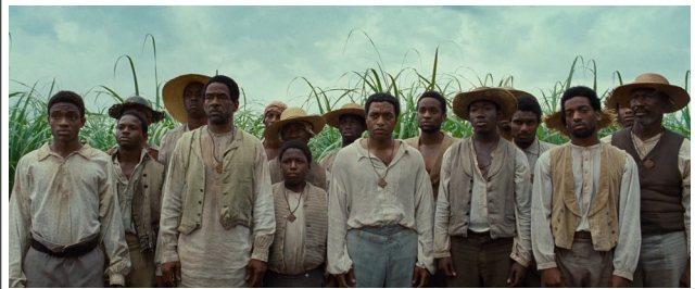
Twelve Years a Slave , Steve McQueen, 2013